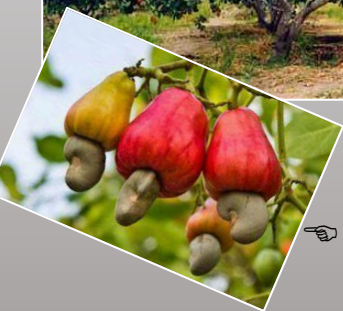
La noix de cajou