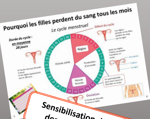
Sensibilisation des filles et des garçons du collège.

Les filles n'ont pas de protection hygiénique, éventuellement quelque chose de très rudimentaire...bout de tissus, feuilles...et souvent, elles ne vont pas à l'école pendant cette période. Les protections jetables n'existent pas, ou alors chères et polluantes.