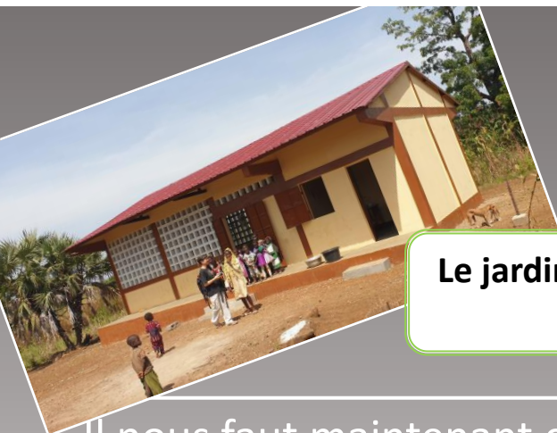
Le jardin d'enfants du village de Kawa-Haut...