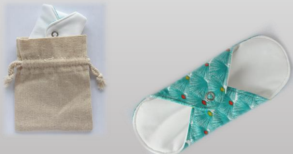
Fabrication locale de 600 protections lavables et leurs petits sacs.