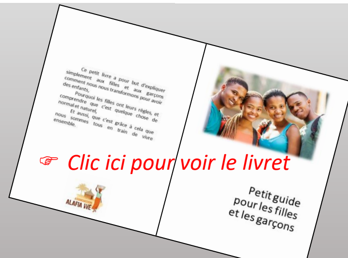
Conception et impression sur place de 600 petits livrets pour les garçons et filles.

Bien souvent TABOU, le cycle menstruel et surtout les règles sont pour les filles, et les garçons, un thème totalement méconnu.